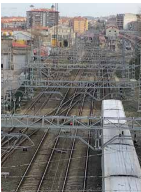
Adif adjudica por 1,08 millones la rehabilitación del puente internacional del Bidasoa, construido en 1860. La obra durará 10 meses y consistirá en mejorar la estructura de esta conexión ferroviaria y reparar la infraestructura.

Así, en el caso de la estación el Ayuntamiento prevé realizar aportaciones relacionadas con una mejor integración del edificio de pasajeros con el entorno, la conexión peatonal con la plaza que se genera frente a la entrada principal de la estación o la pasarela que conecta la calle Estación